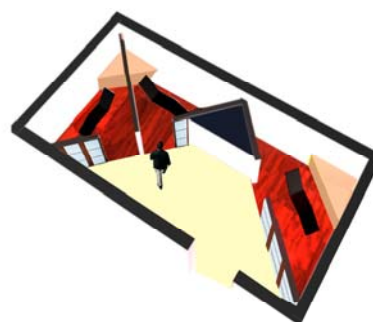
Espace Rel@x de 3 cabines

Contact : Bruno HYPPOLITE au 06.61.54.48.76